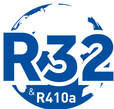
TABELA DE PREÇOS 2019