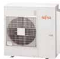
AOY 100UiMI5 / AOY 125UiMI6