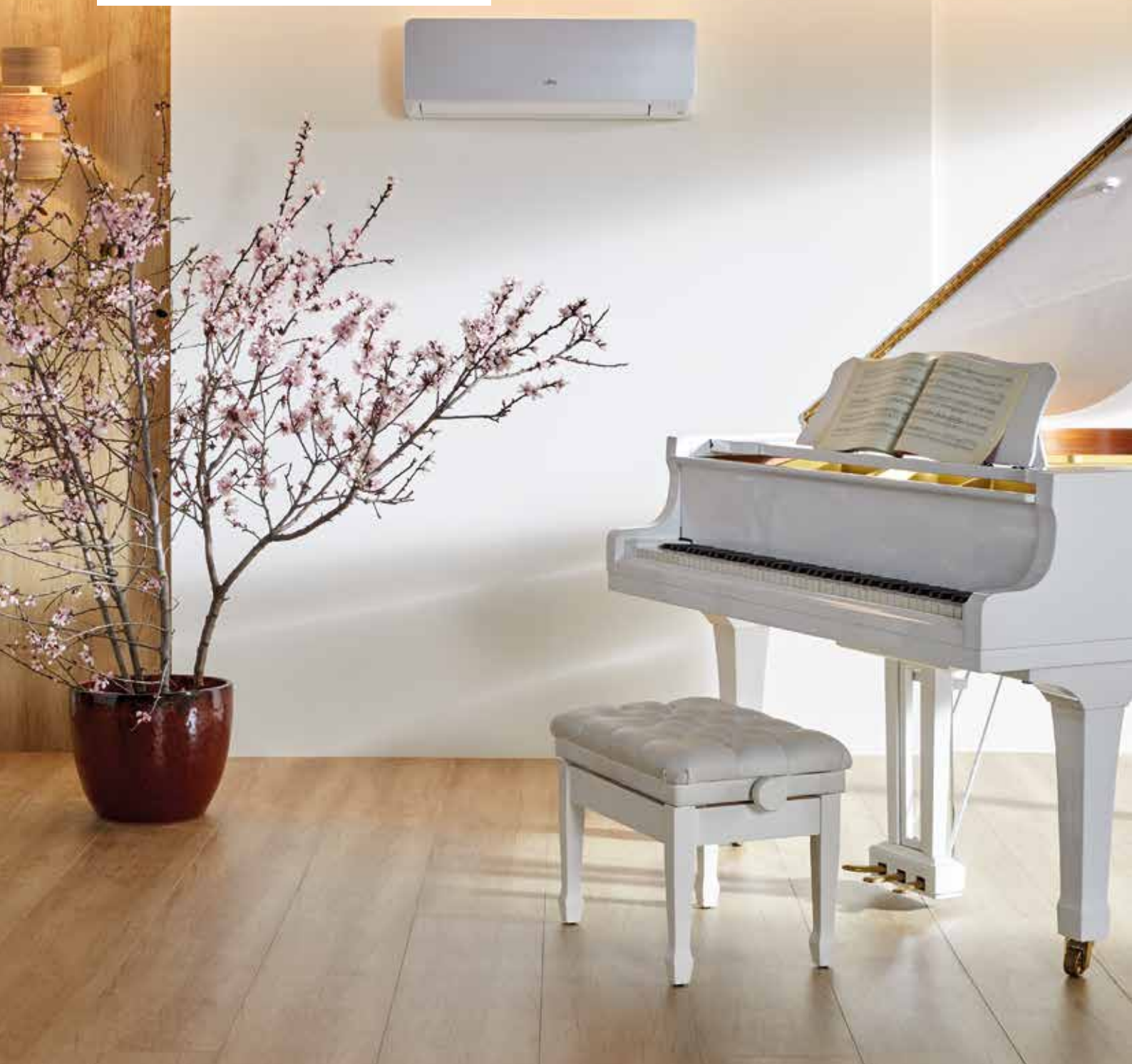
Tabela Climatização 2018