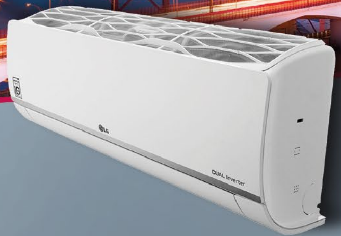
TABELA DE PREÇOS 2018